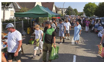
Le marché aux puces du 15 août 2025