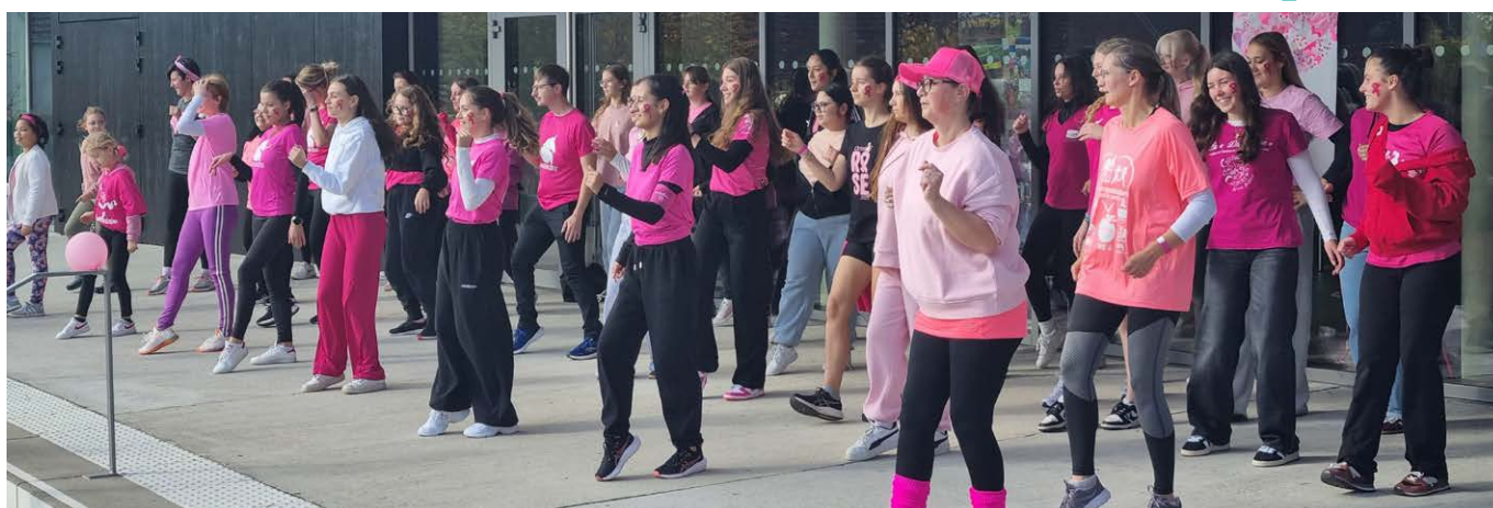
L'association Arizona a animé le départ du Parcours Rose de Sarre-Union le 18 octobre dernier.

Forte de ses 33 années d'expérience, l'association Arizona entame une nouvelle saison avec un enthousiasme contagieux. Chaque mercredi après-midi et chaque samedi toute la journée, le complexe sportif de Sarre-Union résonne au rythme des pas de danse de plus de 90 élèves, âgés de 5 à 25 ans, répartis dans plusieurs groupes.