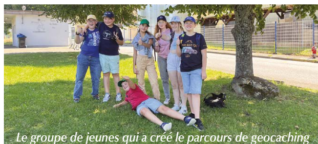
Le groupe de jeunes qui a créé le parcours de géocaching

Cet été, un groupe de sept jeunes, en partenariat avec l'Animation Jeunesse et la Médiathèque de Sarre-Union, a élaboré un parcours de géocaching à Sarre-Union. Le géocaching est une chasse au trésor moderne qui utilise la