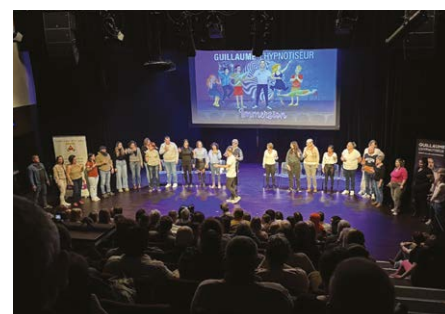
Le spectacle d'hypnose au profit de l'AAPEAI 4 octobre 2025