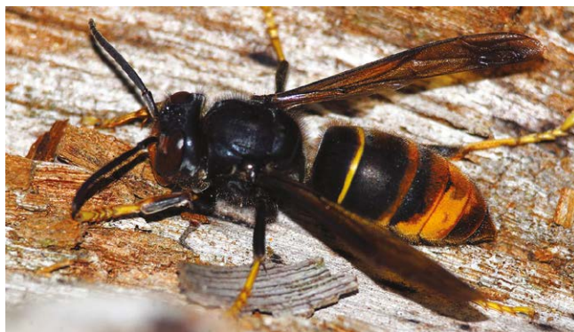
On reconnaît le frelon asiatique à la couleur jaune de ses pattes.

Les nids de frelons asiatiques se situent le plus souvent en hauteur : à la cime des arbres, dans les combles ou sous une toiture. Mais ils peuvent également s'installer dans d'autres endroits plus inattendus.