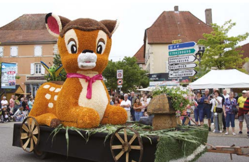
Le Corso Fleuri - 6 juillet 2025