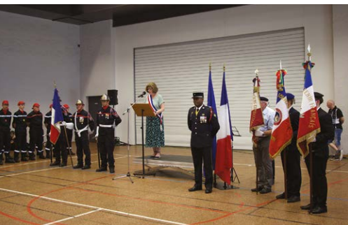
La cérémonie du 14-Juillet 2025