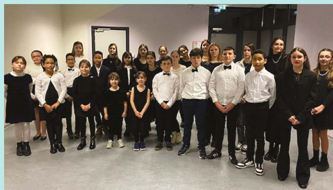
Le Petit Chœur de l'École de Musique a notamment participé au concert de l'Avent de la Philharmonie.

FB : École de Musique et de Danse Sarre-Union