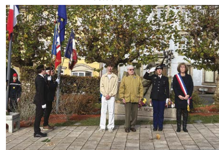
La cérémonie du 11-Novembre 2025