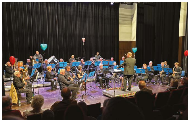
Lors du concert de la fête des Mères le 24 mai 2025.

La saison 2025-2026 a débuté en septembre avec la reprise des répétitions. Après le concert de l'Avent qui s'est tenu le dimanche 30 novembre, les musiciens et leur chef préparent activement le concert d'Hiver du samedi 31 janvier 2026, avec la participation de la Musique Municipale de Grosbliederstroff, orchestre invité pour l'occasion. En parallèle, la Philharmonie continue de prendre part aux cérémonies commémoratives organisées par la commune (11 novembre, 8 mai, 14 juillet).