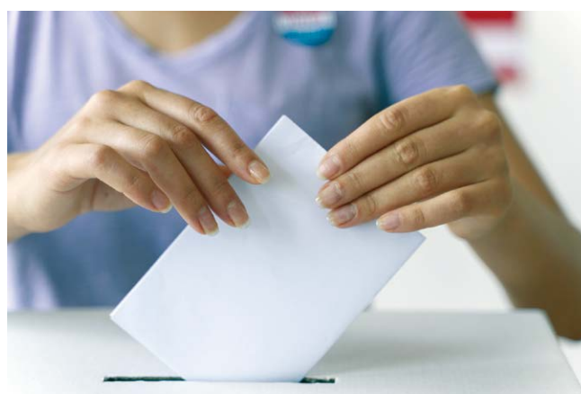
Mettre son bulletin dans l'urne, c'est affirmer son engagement citoyen et contribuer à la vitalité démocratique de notre commune.

Les élections municipales déterminent l'équipe qui pilotera les projets de notre ville pour les six prochaines années. Votre participation est essentielle pour construire ensemble l'avenir de Sarre-Union.