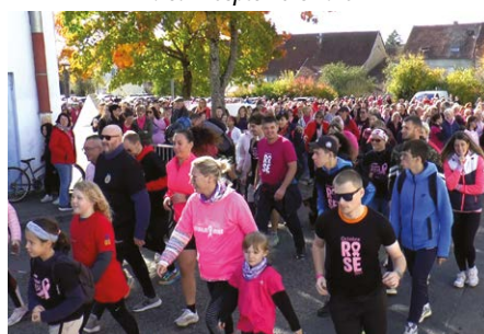
Le Parcours Rose - 18 octobre 2025