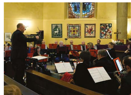
Le concert de l'Avent de la Société Philharmonique 30 novembre 2025