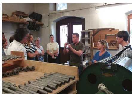
Les Journées Européennes du Patrimoine 20 et 21 septembre 2025