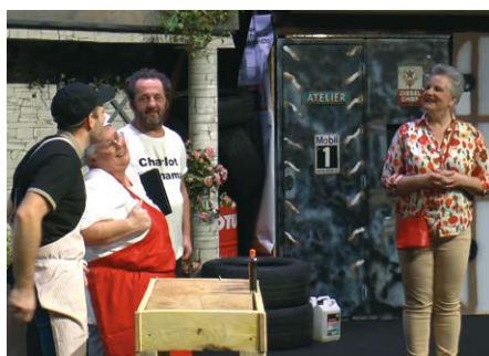
Les représentations du Bocksbrünne Théâtre Novembre 2025