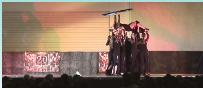
Lors du concours régional de danse moderne 2025 avec le groupe junior Xouax Mambo de Xouaxange lauréat dans sa catégorie.

Ce planning hebdomadaire sera également diffusé sur le site Facebook de l'Association. L'Association organisera également son 21ème Concours de Danse Moderne le 14 mars prochain à Sarre-Union.