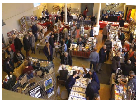
Le Petit Marché de Noël au Temple Réformé 30 novembre 2025