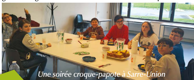
Une soirée croque-papote à Sarre-Union

Pour consulter le programme complet, rendez-vous sur la page Facebook «Animation Jeunesse Alsace Bossue» ou contactez la responsable à l'adresse suivante : marilyn.helf@fdmjc-alsace.fr .