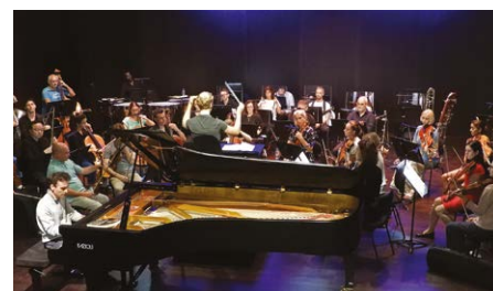
Le concert de Jonathan Fournel et l'Orchestre National de Mulhouse - 20 septembre 2025