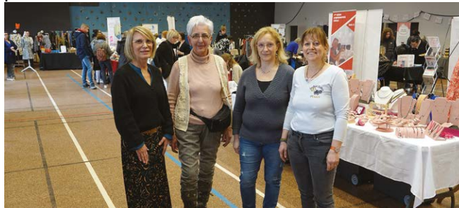
Sarre-Union Dynamik soutient le salon de la vente à domicile et du bien-être.

soutien à une association dont l'objectif était de réaliser un raid humanitaire en Jordanie. L'un des projets est de faire une présentation vidéo des membres de l'Association.