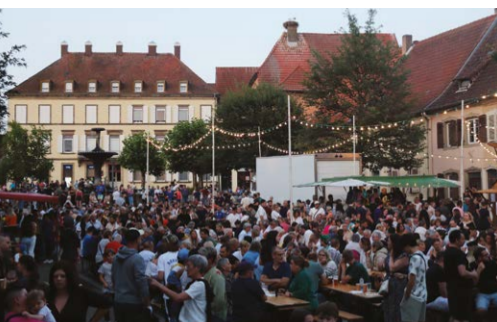
Le bal populaire du 14-Juillet 2025