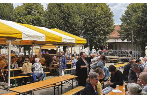
La kirb de la Villeneuve - 3 août 2025