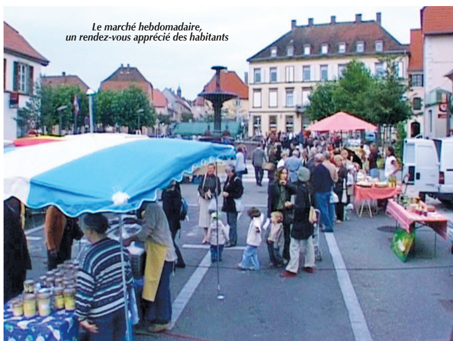
Le marché hebdomadaire, un rendez-vous apprécié des habitants

Malgré un contexte national tendu et une situation difficile que connaissent toutes les collectivités de notre taille, la commune et ses partenaires institutionnels jouent leur rôle de facilitateur afin d'accompagner au mieux les créateurs d'entreprises, ainsi que les entreprises existantes.