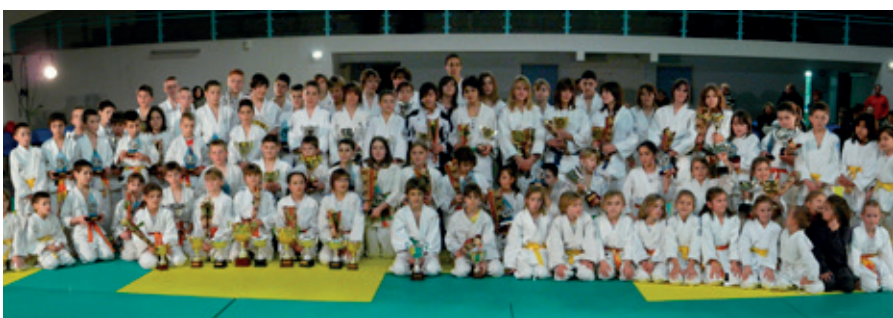
La commune a participé à l'acquisition du tatami du judo club.