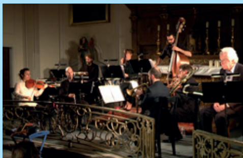
Le concert en hommage à la Grande Guerre dans le cadre du Festival de Fénétrange 20 octobre 2018