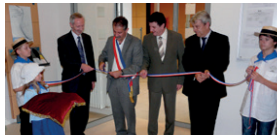
Lors de l'inauguration de l'hôtel des finances après rénovation, le 9 juin 2008.

Dans le souci de préserver la présence des services publics en zone rurale, la commune a mené au cours de 2007, une opération de rénovation des locaux de l'Hôtel des Finances. Les services de la Trésorerie et du centre des impôts occupaient précédemment une partie du bâtiment. La création d'un point d'accueil commun a pour