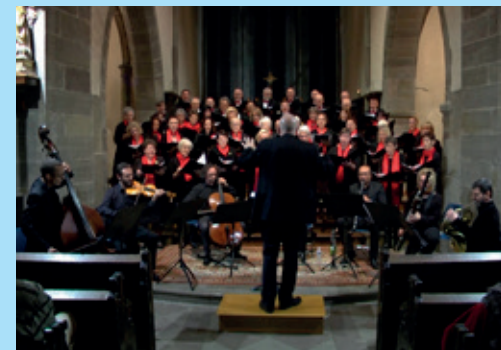
Le concert de l'ensemble vocal et instrumental du Conservatoire de Sarreguemines - 10 novembre 2018

Sans oublier le marché hebdomadaire sur la Place de la République chaque mercredi de 8h à 12h.