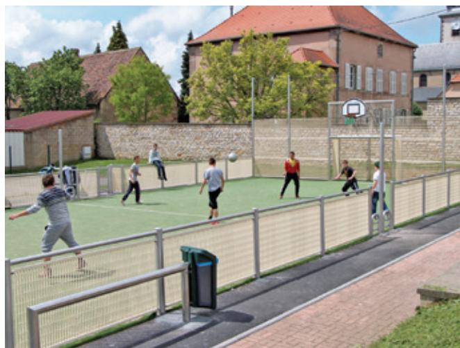
La création d'un city-stade dans la rue du Chalet a été particulièrement appréciée des plus jeunes adeptes de sports.