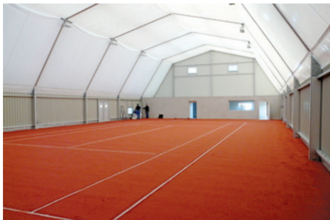
D'importants travaux ont été réalisés pour l'activité tennis par la construction d'un cours de tennis couvert avec vestiaire et club-house.

L'activité équestre s'est diversifiée tout au long de ces dernières années avec d'autres formes d'activités telles que les ballades, poney-games et randonnées. Le club organise plusieurs concours durant l'année attirant de nombreux cavaliers d'Alsace et de Lorraine. Plusieurs cavaliers membres du club ont remporté de nombreuses victoires en concours.