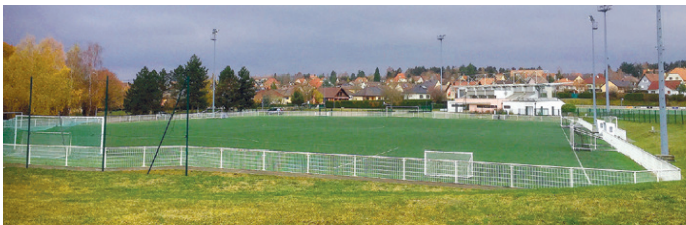
En 2005, la ville a opté pour la réalisation d'un terrain synthétique avec la participation du département qui a financé 50% de l'investissement. Cette surface permet de s'adonner aux joies du foot tout au long de l'année et accueille également tous les scolaires pour tous types d'activités sportives.