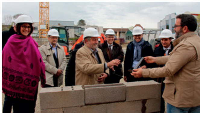
La pose de la première pierre du futur Centre Socio-Culturel le 13 avril 2018

Nous sommes persuadés que ce nouvel équipement contribuera pleinement au dynamisme de notre commune et de l'ensemble de notre territoire d'Alsace-Bossue.