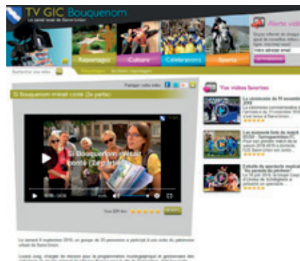
Le portail tvgicbouquenom.fr permet à tout un chacun de visionner les vidéos de la télévision locale de Sarre-Union

Un partenariat avec l'EHPAD permet aux résidents, depuis janvier 2017, de découvrir les montages réalisés ces dernières années, un moyen de garder un lien fort avec la vie de la région. TV GIC Bouquenom a aussi contribué régulièrement au magazine « Couleurs d'Alsace » diffusé sur la Chaîne Alsace 20. La chaîne permet à la ville de Sarre-Union de se constituer au fil des ans une archive audiovisuelle de grande valeur patrimoniale.