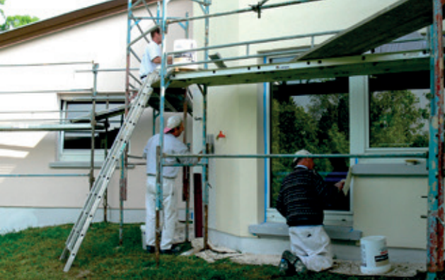
L'entretien des bâtiments publics est fondamental. La façade arrière de l'école maternelle a fait peau neuve.