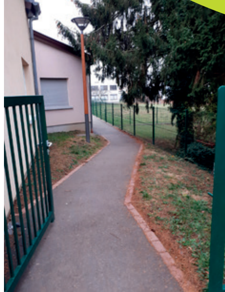
Les parents peuvent accéder à la cour de l'école pour chercher leurs enfants grâce au chemin sécurisé qui contourne l'école maternelle.