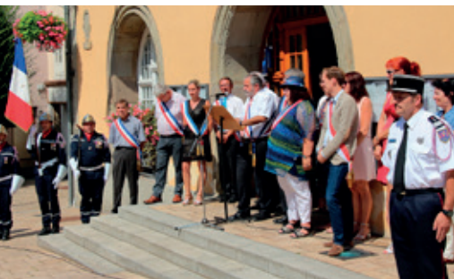
La cérémonie du 14 juillet 2018