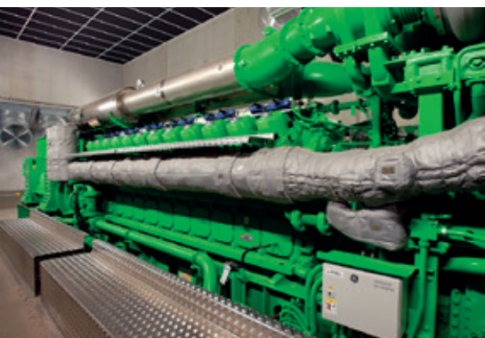
La centrale est équipée d'un moteur à gaz à haut rendement énergétique.

Au terme de 7 mois de travaux, la centrale de cogénération (électricité et chaleur) de Sarre-Union a été mise en service ce 1 er novembre, anticipant de quelques semaines son inauguration officielle le 14 décembre dernier. Porté par des acteurs locaux engagés, ce nouvel équipement apporte une réponse opportune aux enjeux énergétiques du territoire.