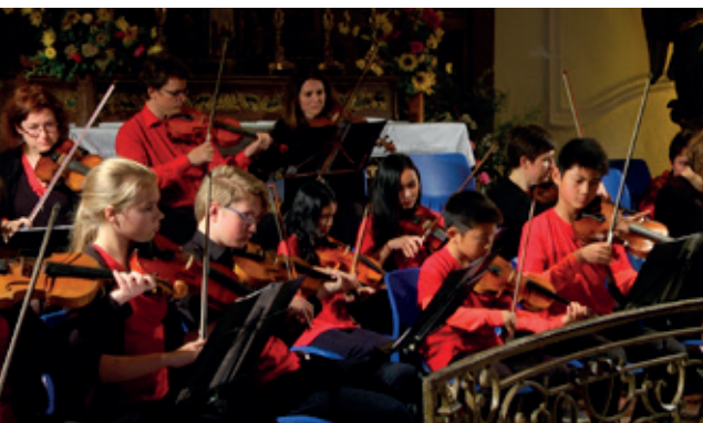
L'éblouissant orchestre à cordes de Strinda composé de 55 jeunes s'est produit en octobre 2016 à la Chapelle des Jésuites.

Filigrane en 2013 et le Parlement de Musique sous la direction de Martin Gester en 2016. Les concerts de l'orchestre à cordes de Strinda (Norvège) à la Chapelle des Jésuites en 2016, de l'orchestre Philharmonique des Jeunes de Strasbourg et de l'orchestre départemental de Seine et Marne en 2017 resteront des moments forts.