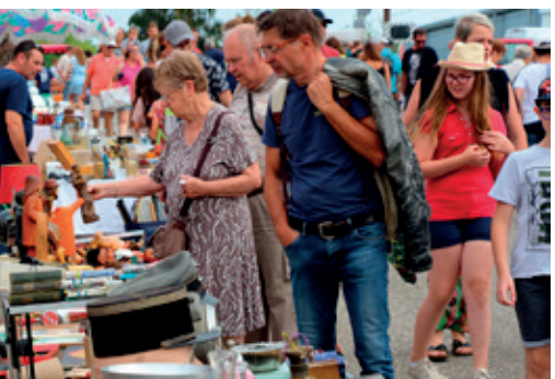
Le marché aux puces - 15 août 2018