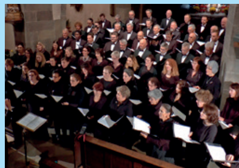
Le concert du Chœur Philharmonique de Strasbourg 24 novembre 2018