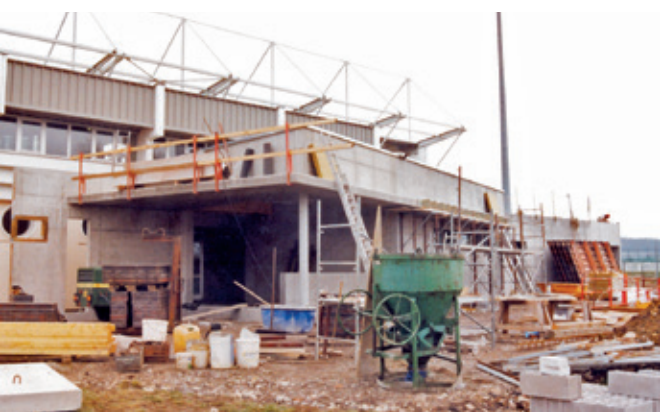
Les vestiaires de l'enceinte du stade Omnisports ont été mis aux normes. Cette réfection a été l'occasion d'ajouter des vestiaires supplémentaires pour les autres activités sportives (athlétisme, course à pied...) et l'accueil des scolaires.