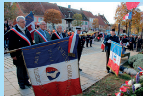
La cérémonie du 11 novembre 2018, centenaire de l'Armistice