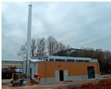
La centrale de cogénération a été inaugurée le 14 décembre dernier.