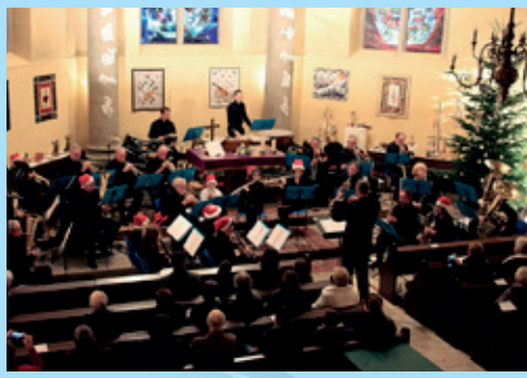
Le concert de l'Avent de la Société Philharmonique 2 décembre 2018