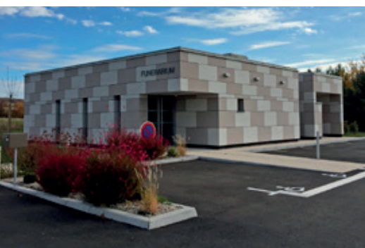
Le nouveau funérarium, un bâtiment digne et élégant.

Ce bâtiment a coûté 555 352 € TTC. Le Conseil départemental du Bas-Rhin a versé une subvention s'élevant à 142 940 €.