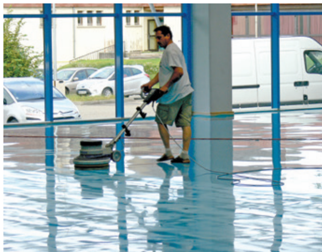
La réfection du sol du gymnase était nécessaire et permet dorénavant d'évoluer sur une surface adaptée et aux normes en vigueur.