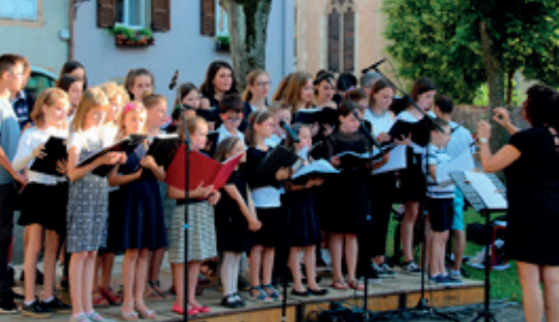
La fête de la musique de l'École de Musique 21 juin 2018