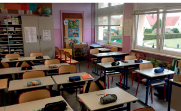
L'ensemble des salles de classe de l'école élémentaire ont été rénovées. Les enfants ont la chance d'étudier dans un cadre très agréable.