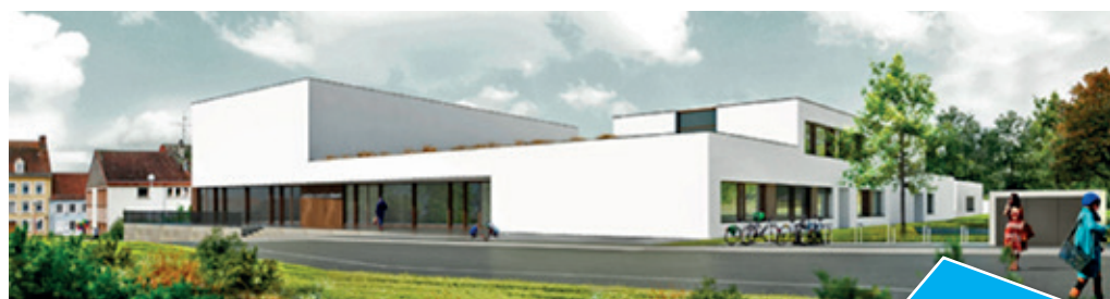
La livraison du futur centre socio-culturel est prévue pour le mois de juin 2019.

Cet engagement démontre l'intérêt porté par ces instances pour un tel équipement structurant sur notre territoire de l'Alsace Bossue.