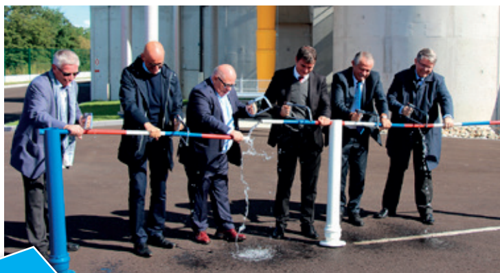
La nouvelle station d'épuration a été inaugurée le 16 septembre 2017.

Forts de cette réussite, les délégués des différentes communes au SDEA ont décidé de renforcer encore la mutualisation en unifiant l'ensemble du service assainissement, collecte, transport et traitement, dans une seule et même entité, le périmètre SDEA de la Vallée de la Sarre-Sud. Ce choix de solidarité intercommunale se traduira par une redevance assainissement maîtrisée et unifiée à l'horizon 2021 et permettra la réalisation d'investissements sur les réseaux communaux en maintenant la redevance stable grâce aux économies réalisées et à l'autofinancement dégagé.