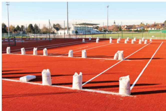
La surface des deux cours de tennis extérieurs a été rénovée par la mise en place d'un gazon synthétique. Le club bénéficie d'un outil de qualité permettant à l'activité de se dérouler dans de très bonnes conditions.

L'ensemble de ces équipements est mis à disposition gratuitement aux associations locales. Leur coût de fonctionnement annuel s'élève à plus de 220 000 €.