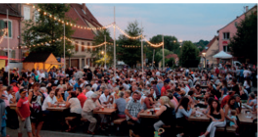
Le bal populaire et le feu d'artifice - 14 Juillet 2018