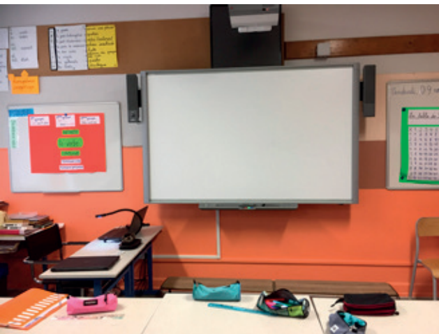
Les classes de maternelle sont équipées de tablettes numériques. Certaines classes de l'école élémentaire bénéficient d'un TNI (tableau numérique interactif), équipement qui enchante l'ensemble des élèves ainsi que leurs enseignants. L'équipement numérique des classes se poursuit.