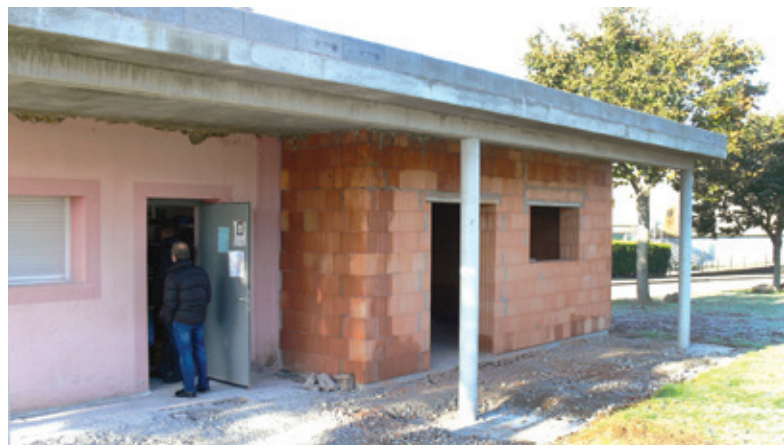
La ville a réalisé un boulodrome et par la suite un local destiné au bon fonctionnement de l'activité permettant au club d'organiser régulièrement des concours dans de bonnes conditions.

D'autres activités sont proposées telles que la danse moderne, la zumba, etc... avec Arizona dirigée par Pascale Fromageat et Clip Tonic par Sylvie Rinn, qui chaque année offrent des spectacles de danse de qualité, hauts en couleur.