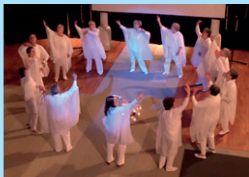
Le spectacle « Lumière de novembre » par l'association Danses Nature et Poésies - 18 novembre 2018