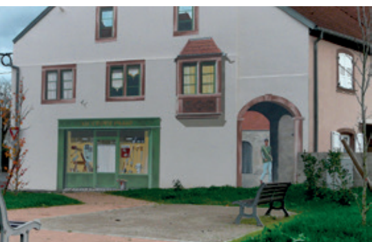
Des travaux parmi lesquels ce mur en trompe-l'œil, ont été réalisés sur la placette de la rue des Jardins

Au cours de 2017, une opération de remplacement de luminaires anciens par des LED a été menée. En termes de consommation électrique, cette opération a permis de générer une économie de 60 à 70 %.