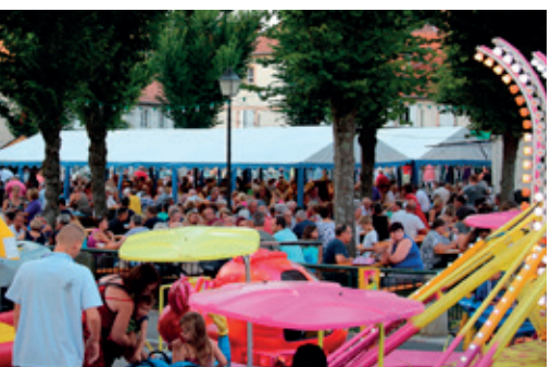
La kirb de la Villeneuve - 5 août 2018