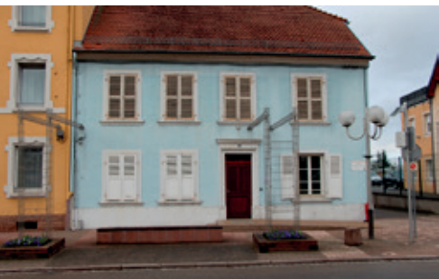
L'immeuble communal au 25 rue de Phalsbourg accueille les services de l'EPSAN.