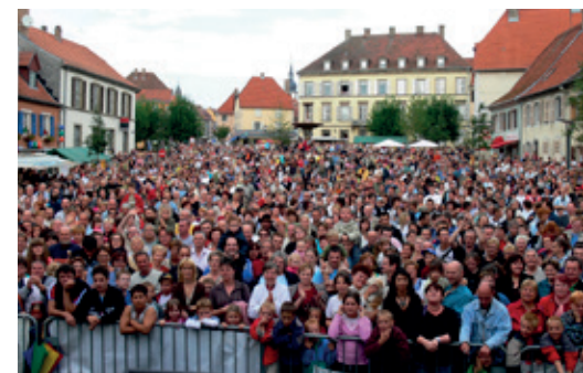
Une foule immense est présente chaque année lors du concert proposé lors de la fête d'automne.