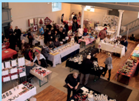
Le petit marché de Noël au Temple Réformé 2 décembre 2018