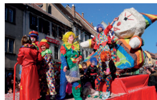
Une trentaine de chars et près de 600 fugurants participent à la traditionnelle cavalcade.