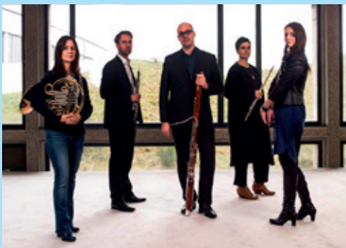
Le concert de l'Ensemble FOCUS au Temple Réformé 3 novembre 2018