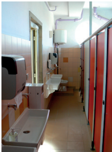
Les sanitaires de l'école élémentaire ont été entièrement rénovés.